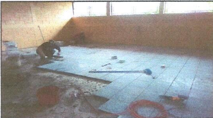
Foto 3: Reparación de piso de torta de concreto por piso de granito