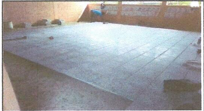
Foto 4: Reparación de piso de torta de concreto por piso de granito