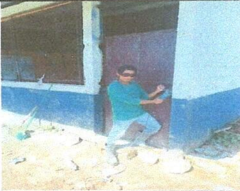
Foto1: Sustitución de puerta