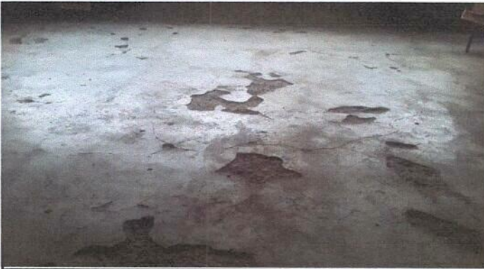
Foto 3: Reparación de piso de torta de concreto por piso de granito