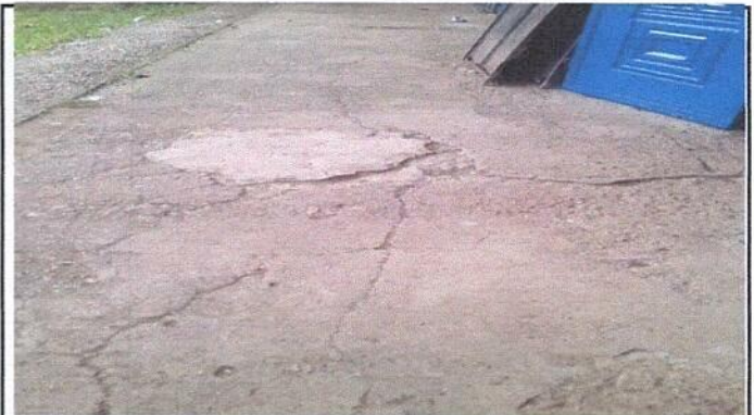
Foto 4: Reparación de piso de torta de concreto por piso de granito