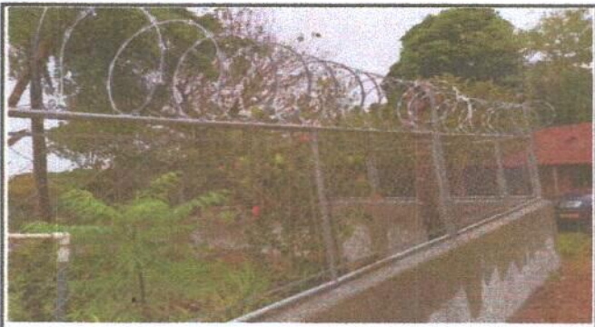
Foto 3: VISTA GENERAL DE LA MALLA DE LA PARTE TRASERA DEL ESTABLECIMIENTO.