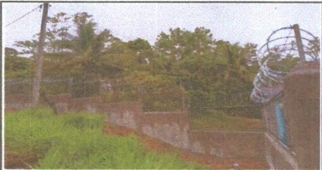
Foto 5: VISTA GENERAL DE A UN COSTADO DE LA ENTRADA DEL ESTABLECIMIENTO.