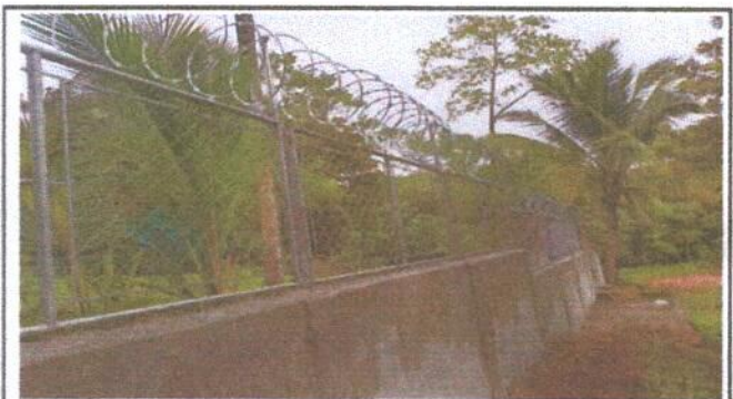
Foto 4: VISTA GENERAL DE LA PARTE DE ENFRENTE DEL ESTABLECIMIENTO.