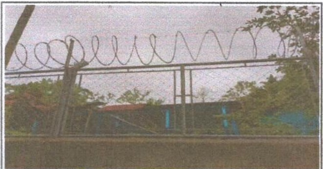
Foto 6: VISTA GENERAL DE LA MALLA DE LA PARTE DE ARRIBA DEL ESTABLECIMIENTO.

Observación: Si es necesario se pueden agregar fotos adicionales y actualizar el número de hojas.