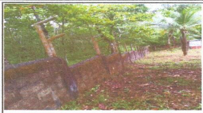
Foto 1: MOMENTO EN DONDE SE QUITÓ LA MALLA Y SE LE DABA MANTENIMIENTO PARA EL REPELLO