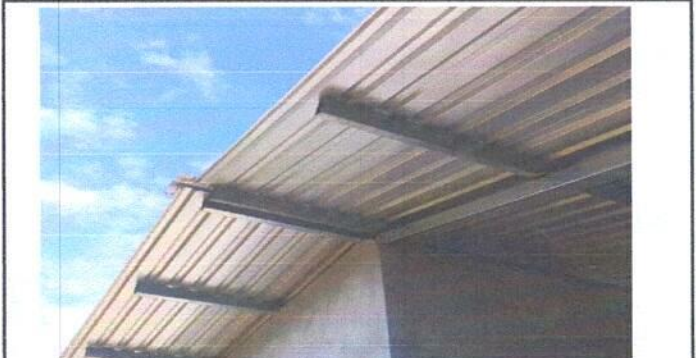
Foto 2: Sustitución de estructura de soporte de madera, por metal.