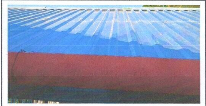
Foto1: Sustitución de lámina, por lamina troquelada aluzinc calibre 26