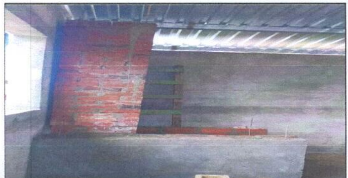
Foto 6: Sustitucion de estufa rural(completa), incluye chimenea y plancha de metal

Observación: Si es necesario se pueden agregar hojas adicionales y actualizar el número de hojas.