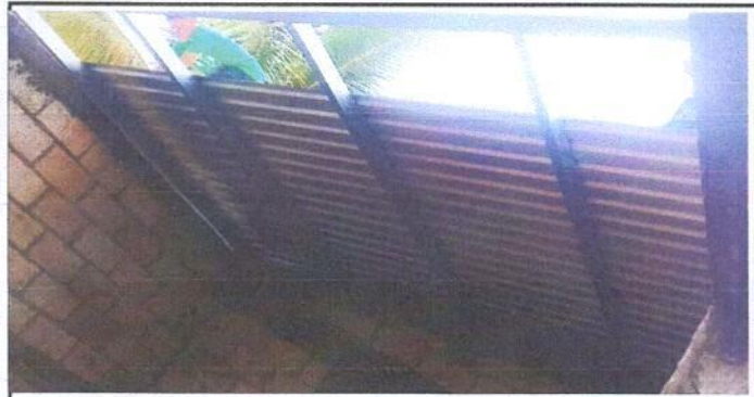
Foto1: Sustitución de lámina, por lamina troquelada aluzinc calibre 26