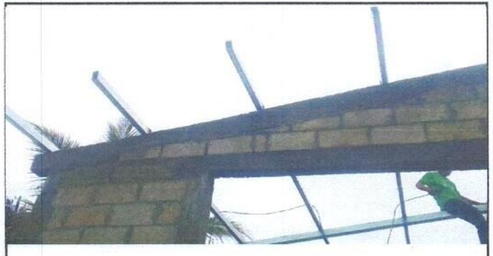
Foto 2: Sustitución de estructura de soporte de madera, por metal.