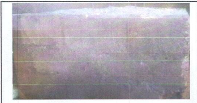
Foto 6: Sustitucion de estufa rural(completa), incluye chimenea y plancha de metal

Observación: Si es necesario se pueden agregar hojas adicionales y actualizar el número de hojas.