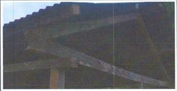
Foto 2: Sustitución de estructura de soporte de madera, por metal.