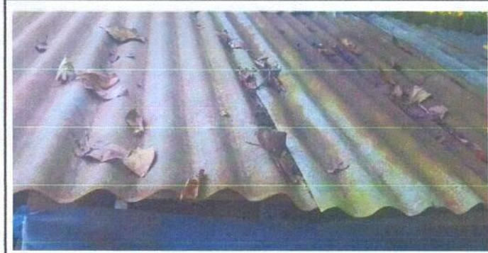
Foto1: Sustitución de lámina, por lamina troquelada aluzinc calibre 26