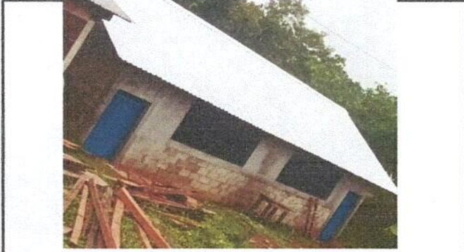
Foto1: Sustitucion de lamina, por lamina troquelada Aluzinc