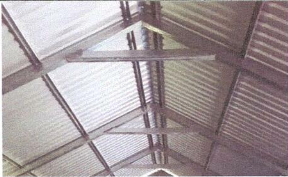
Foto1: Sustitucion de lamina, por lamina troquelada Aluzinc.