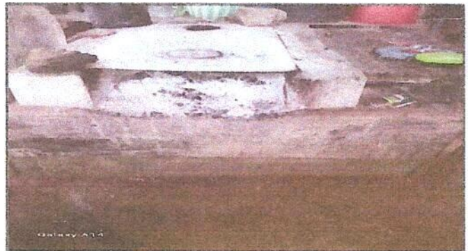
Foto 4: Reparación de estufa rural completa incluye chimenea y planta de metal