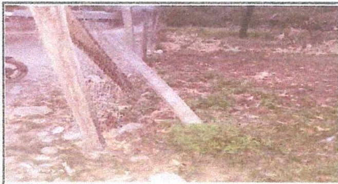
Foto 3: Reparación de muro perimetral con tubo hg y malla galvanizada