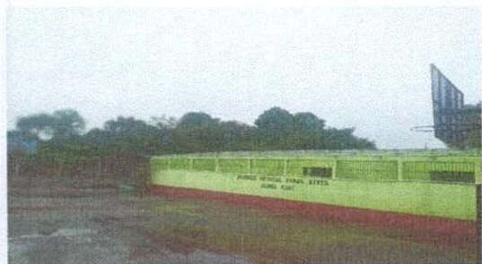
Foto1: 328 M DE TECHADO