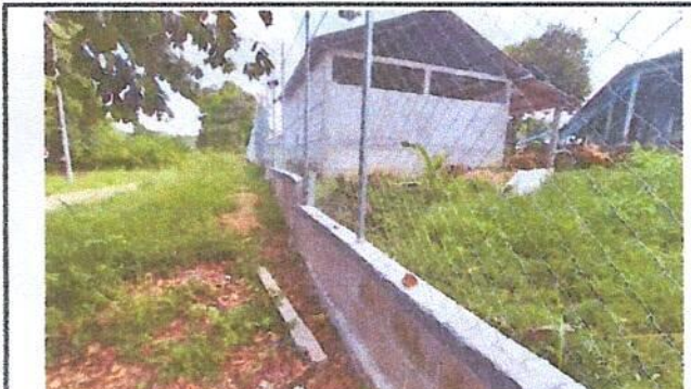
Foto 3: Reparación de muro perimetral con tubo hg y malla galvanizada