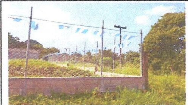
Foto 1: Reparación de muro perimetral con tubo hg y malla galvanizada