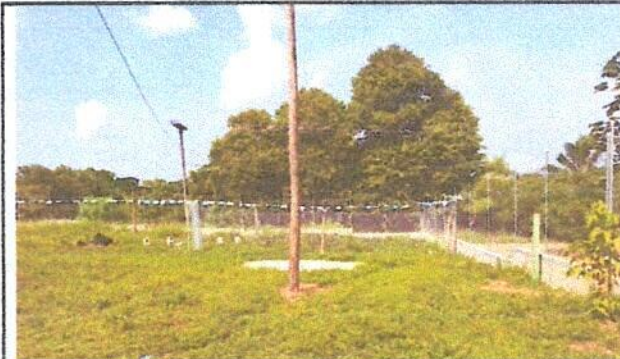
Foto 4: Reparación de muro perimetral con tubo hg y malla galvanizada