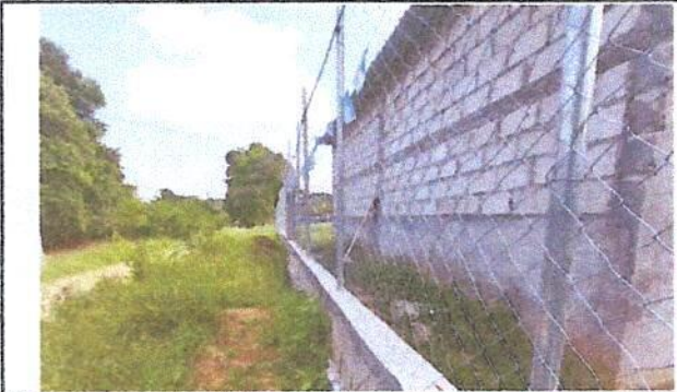
Foto 2: Reparación de muro perimetral con tubo hg y malla galvanizada