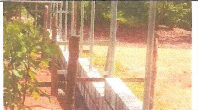
Foto 4: Reparación de muro perimetral con tubo hg y malla galvanizada