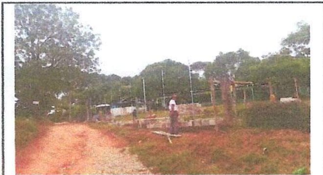
Foto 1: Reparación de muro perimetral con tubo hg y malla galvanizada