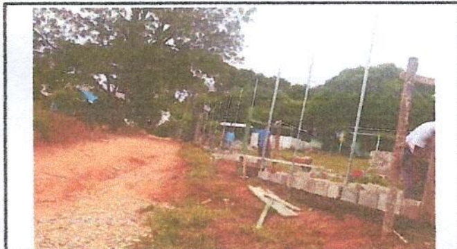
Foto 3: Reparación de muro perimetral con tubo hg y malla galvanizada