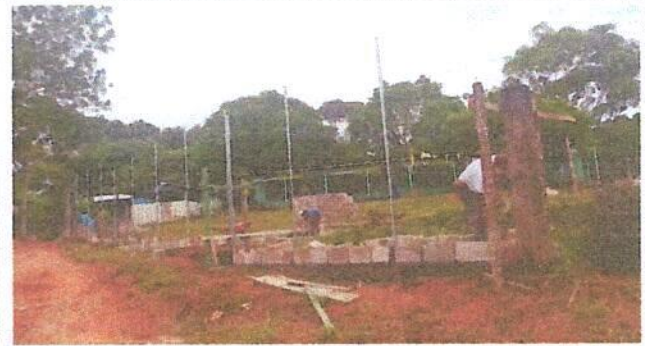
Foto 2: Reparación de muro perimetral con tubo hg y malla galvanizada