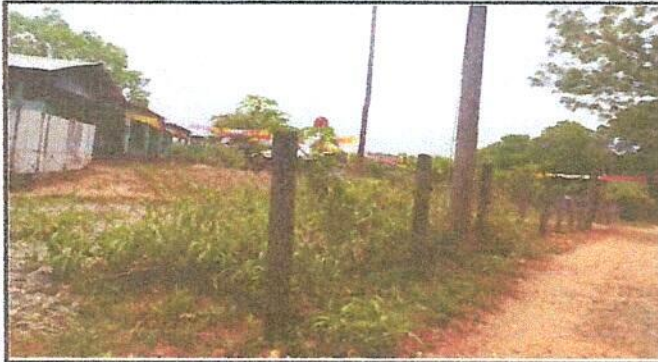
Foto 1: Reparación de muro perimetral con tubo hg y malla galvanizada