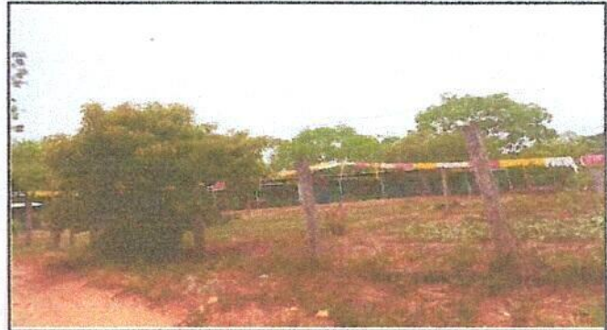
Foto 2: Reparación de muro perimetral con tubo hg y malla galvanizada