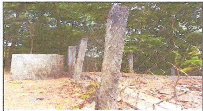
Foto 4: Reparación de muro perimetral con tubo hg y malla galvanizada