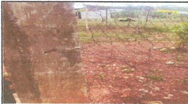
Foto 3: Reparación de muro perimetral con tubo hg y malla galvanizada