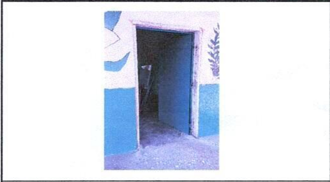
Sustitucion de puertas de madera por metal EN LA DIRECCION