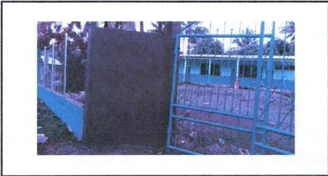
REPELLO DE PORTON Y SUSTITUCION DE PORTON

Observación: Si es necesario se pueden agregar fotografías para actualizar el número de hojas.