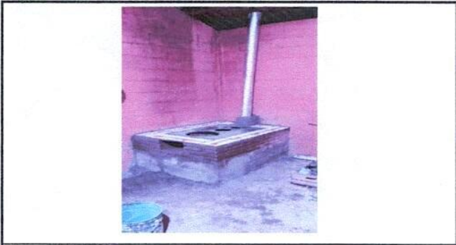
Avance de trabajo