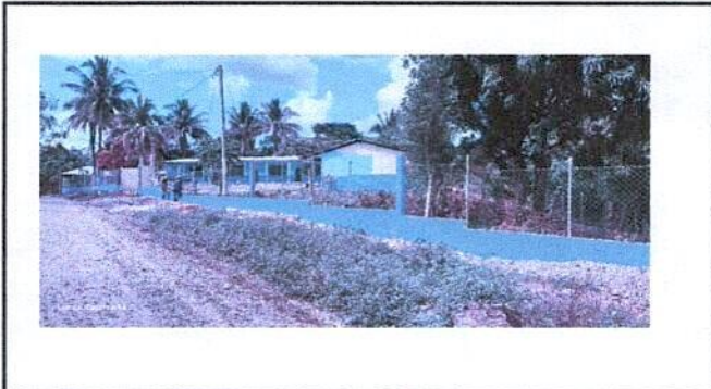
Sustitucion del muro perimetral lado oriente del establecimiento