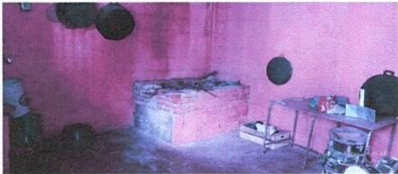
Avance de trabajo