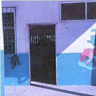
sustitucion de puertas de madera por metal