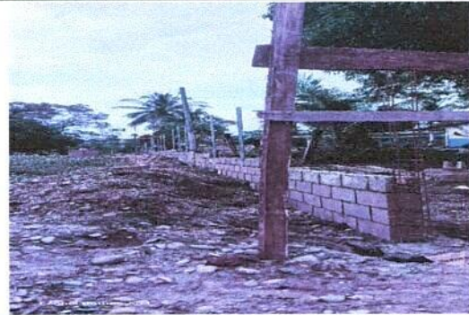
Sustitucion del muro perimetral lado oriente del establecimiento