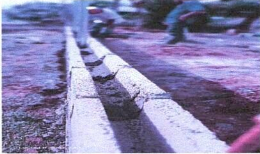
Sustitucion de muro perimetral lado frontal del establecimiento