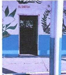
Sustitucion de puertas de madera por metal