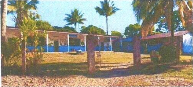
Foto1: Sustitucion de Muro Perimetral