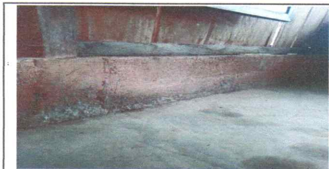
Foto 3: REPARACION DE DE REPELLO Y CERNIDO DE CERNIDO(CUANDO APLIQUE)