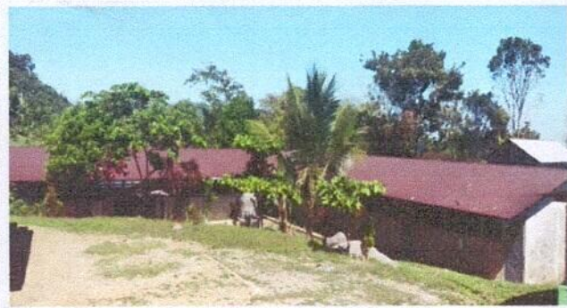
Foto1: Sustitución de lamina, por lamina troquelada aluzinc del centro educativo.