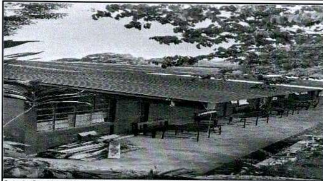
Foto 1: Sustitución de lámina, por lámina troquelada aluzinc calibre 26, del modulo 2.