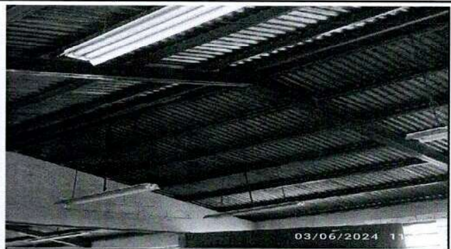
Foto 2: Mantenimiento a estructura de soporte de metal por daños de óxido.