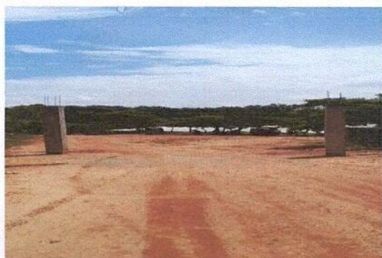
Foto 3 Porton de metal