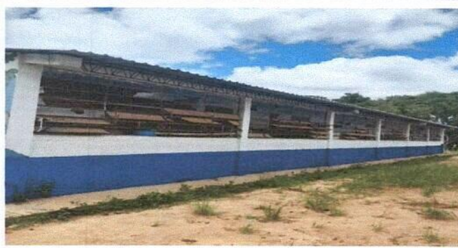
Foto 4 Sustitucion de estructura de metal de ventanas