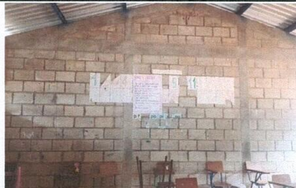
Foto 2 Pinturas exteriores e interiores