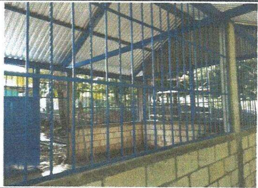
Sustitución de balcones de metal, modulo cocina

Observación: Si es necesario se pueden agregar hojas adicionales y actualizar el número de hojas.