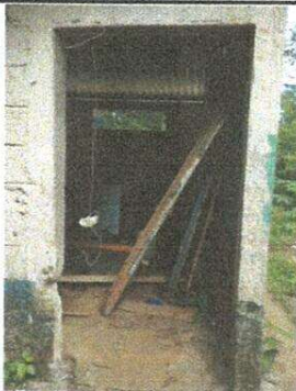
Sustitución de puerta para cocina