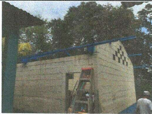
Sustitución de lámina, por lámina troquelada Alucinc calibre 26