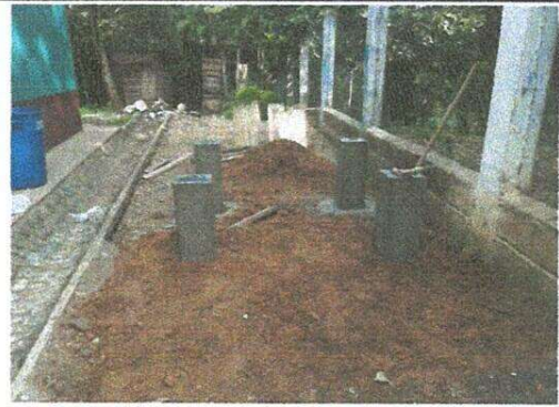
Bases para sustitución de depósito de agua 1100 Lt