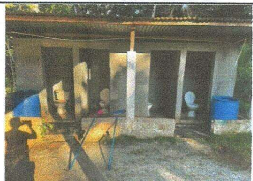
Sustitución de puerta en servicio sanitario