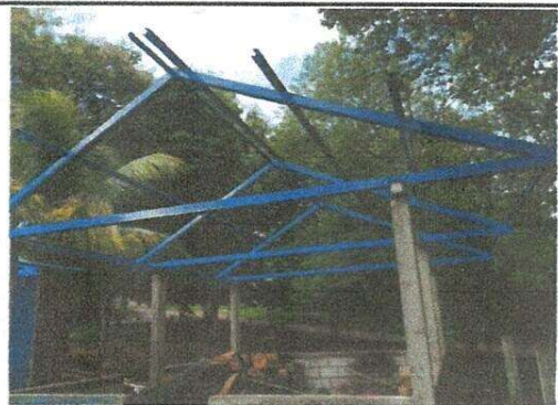
Sustitución de estructura de soporte de madera por metal, modulo cocina