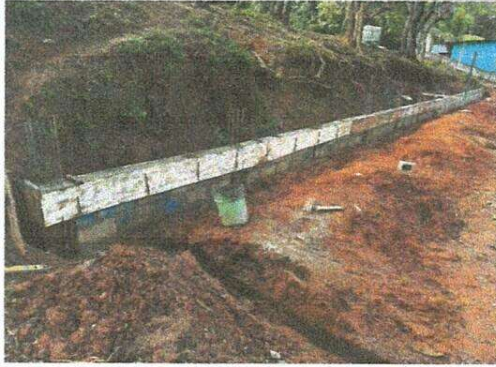
Reparación de muro perimetral de block