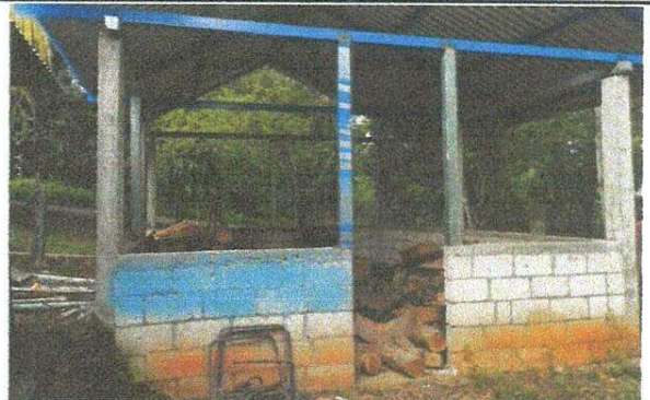
Sustitución de balcones de metal, modulo cocina

Observación: Si es necesario se pueden agregar hojas adicionales y actualizar el número de hojas.