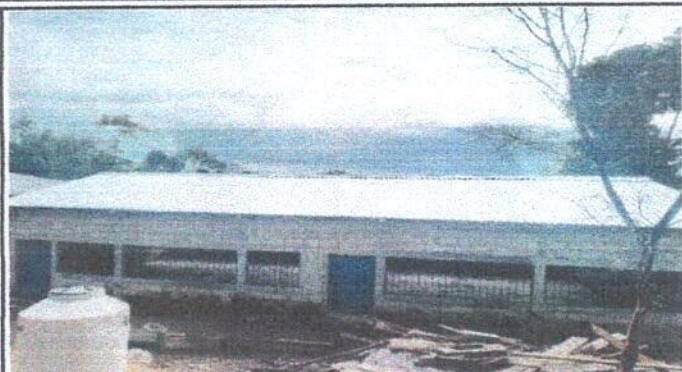
Foto 1: Sustitución de lámina, por lámina troquelada aluzinc calibre 26.