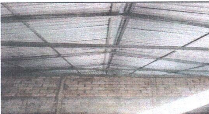
Foto 3: Sustitución de estructura de soporte de madera por metal.