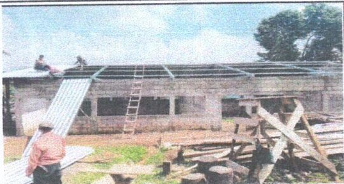
Foto1: Sustitucion de lámina, por lamina troquelada calibre 26