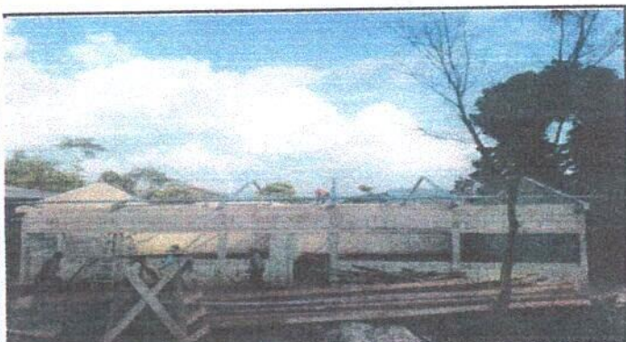
Foto 3: Sustitución de estructura de soporte de madera por metal.