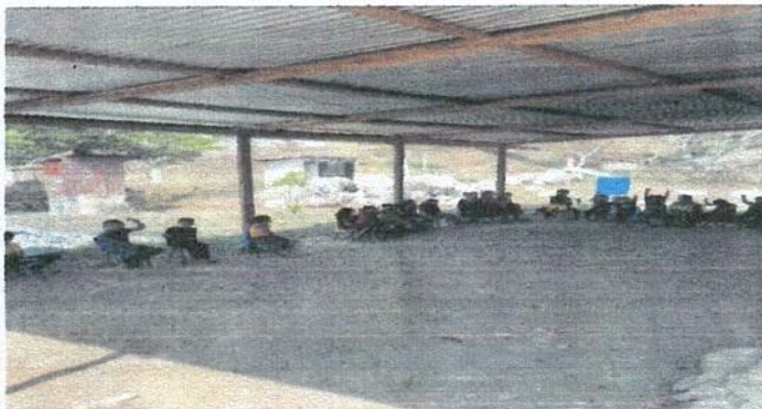
Foto 3: Sustitución de estructura de soporte de madera por metal.