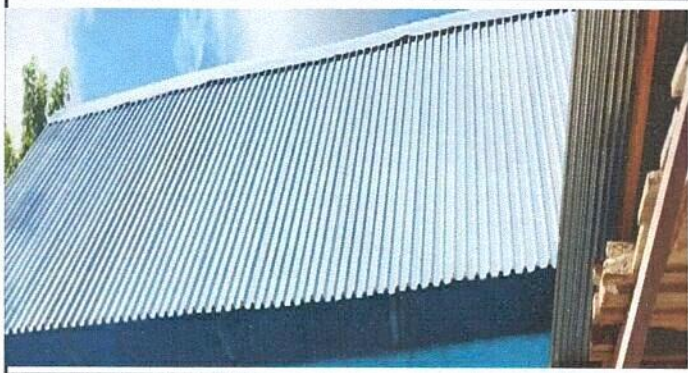
Foto1: Sustitución de lámina por lámina troquelada.