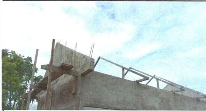
Foto1: Sustitución de lámina por lámina troquelada.