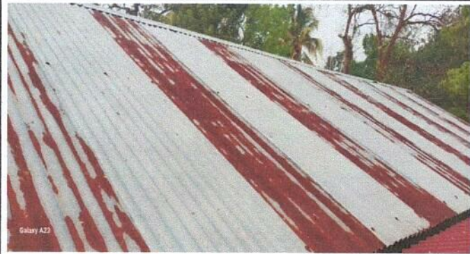
Foto1: Sustitución de lámina por lámina troquelada.