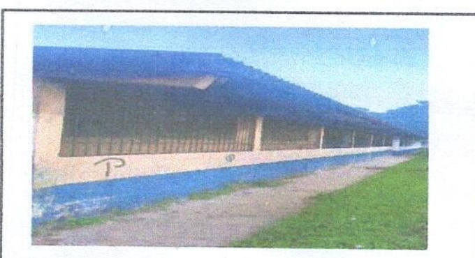
Foto 6: BALCONES INSTALADOS Y FINALIZADO PARTE DE ATRAS DEL MODULO

Observación: Si es necesario se pueden agregar hojas adicionales y actualizar el número de hojas.