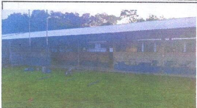
Foto1: MODULO FINALIZADO CON LA ESTRUCTURA DE LAMINA Y BALCONES.