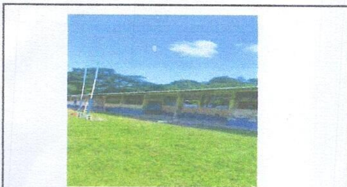
Foto 3: SUSTITUCION DE PUERTAS DE METAL EN MAL ESTADO POR PUERTA DE METAL.