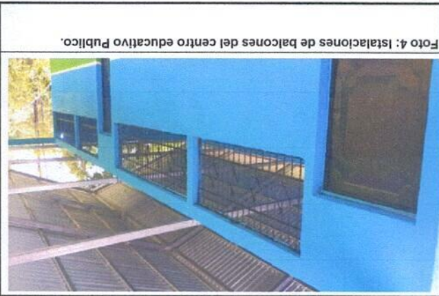
Foto 4: Instalaciones de balcones de metal del centro educativo Público.