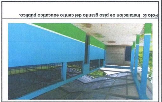
Foto 5: Instalación de piso granito del centro educativo público.