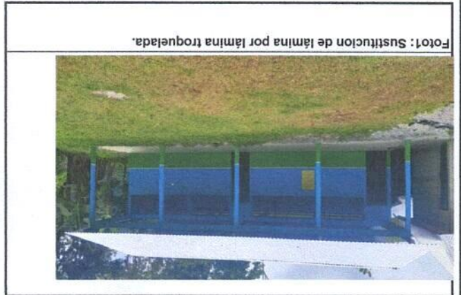
Foto1 : Sustitución de lámina por lámina troquelada.

SITUACIÓN DEFICIENCIAS DETERMINADAS PREVIO DURANTE POSTERIOR