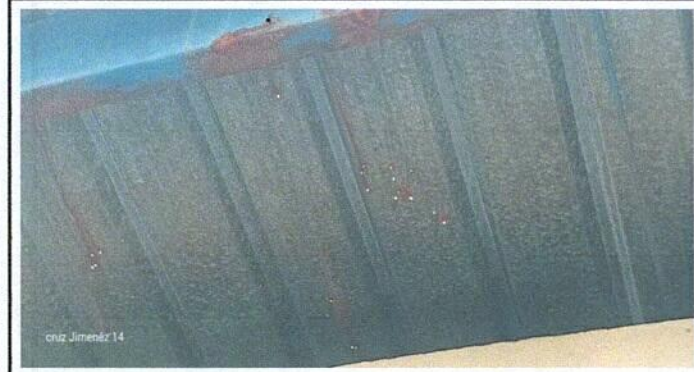
Foto1: cambio de techo por láminas con óxido.