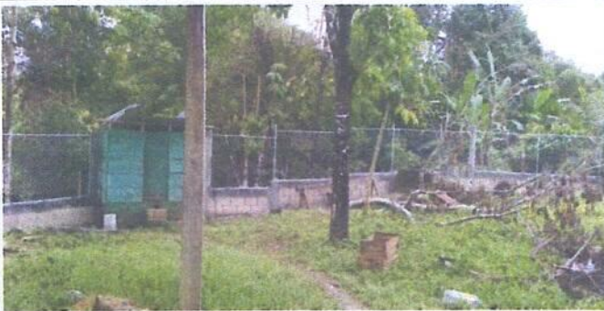
MURO PERIMETRAL PARTE ATRÁS