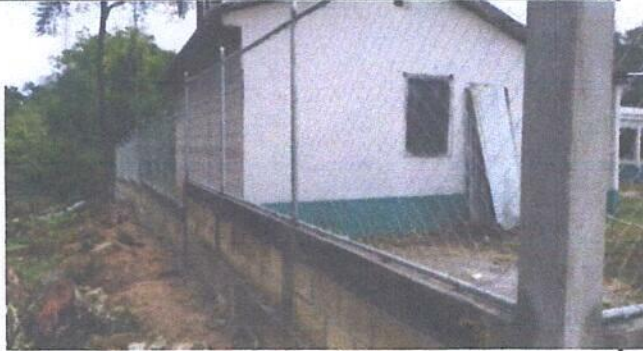
MURO PERIMETRAL PARTE ATRÁS DE LA COCINA