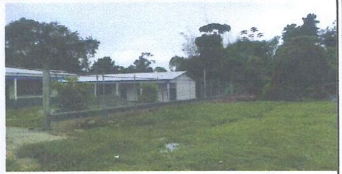
MURO PERIMETRAL PARTE FRENTE DEL CAMPO