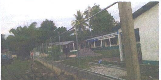
MURO PERIMETRAL PARTE FRENTE DE ESQUINA A ESQUINA