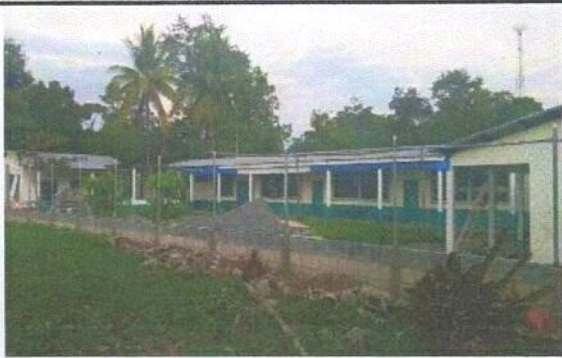
MURO PERIMETRAL LADO DE ENFRENTE