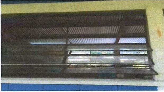
Foto1: Sustitucion de vidrios del centro educativo