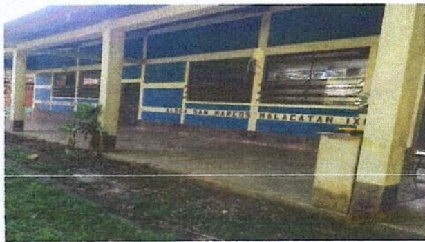
Foto 3: Pintura en muros exteriores e interiores del centro educativo