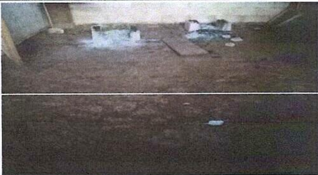
Foto 5: Sustitucion de estufa rural (completa) incluye chimenea y plancha de metal de la cocina