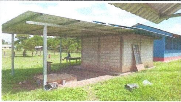
Foto7: Sustitucion de estructura de soporte de madera por metal.