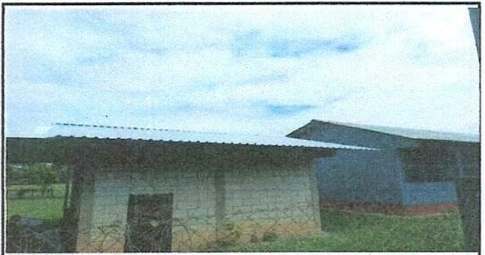
Foto 6: Sustitución de lámina por lámina troqueleada de la cocina escolar

Observación: Si es necesario se pueden agregar hojas adicionales y actualizar el número de hojas.