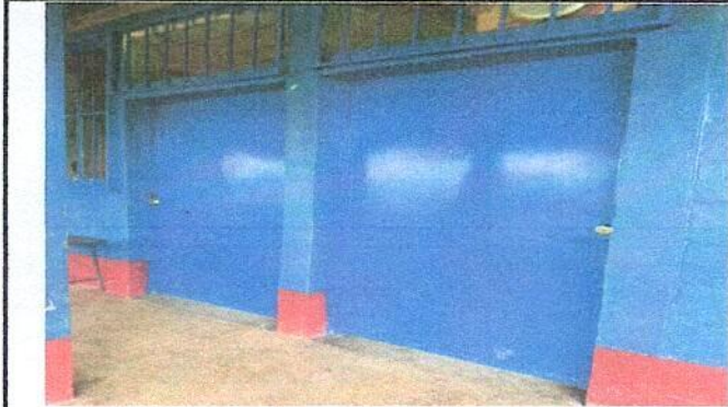
Foto 1: Mantenimiento a estructura de puerta de metal (lijado, cepillado, y aplicación de pintura)