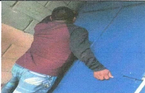
Foto1: Mantenimiento a estructura de puerta de metal (lijado, cepillado, y aplicación de pintura)