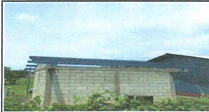
Foto 6: Sustitución de lámina por lámina troqueleada de la cocina escolar

Observación: Si es necesario se pueden agregar hojas adicionales y actualizar el número de hojas.