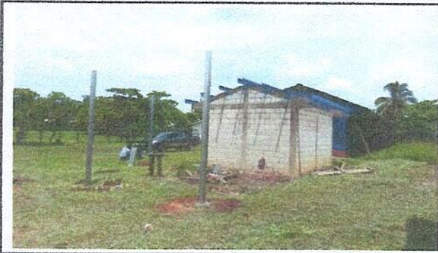
Foto 7: Sustrucción de estructura de soporte de madera por metal.