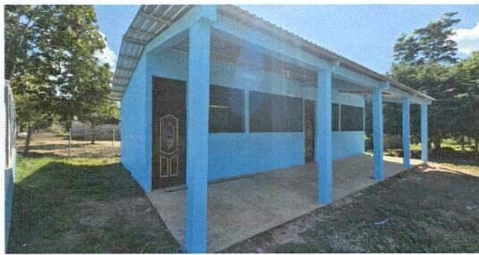
Foto1: ESCUELA OFICIAL DE PÁRVULOS ANEXA A EORM ALDEA SONORA