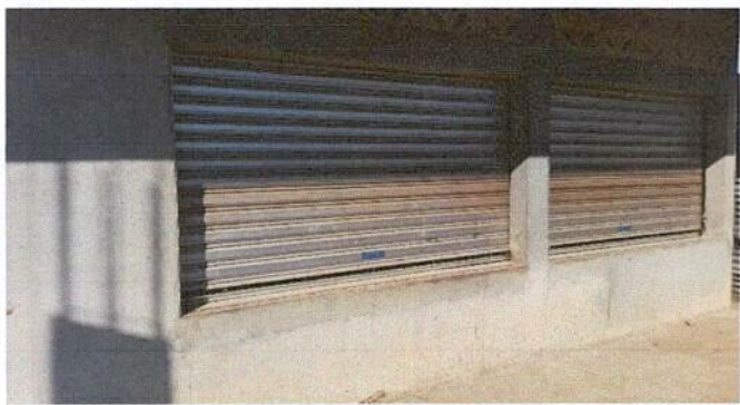
Foto1: COCINA ESCOLAR