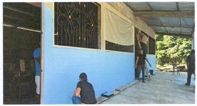
Foto 2: MANO DE OBRA DE PADRES DE FAMILIA EN PINTURA E INSTALACIÓN ELECTRICA