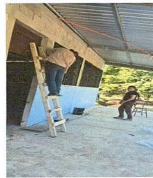
Foto 4: MANO DE OBRA DE LOS PADRES DE FAMILIA EN INSTALACIÓN ELECTRICA