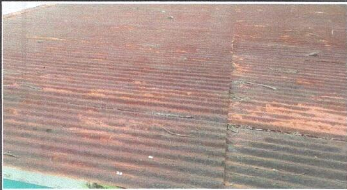
Foto1: Láminas con oxido y agrietadas en varias partes.