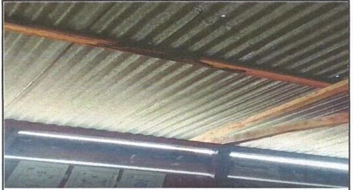
Foto 2: Estructura de madera con pudrición con riesgo de caerse en cualquier momento.