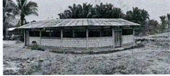
Foto 2: Vista externa de las instalaciones del centro educativo, laminas en mal estado.