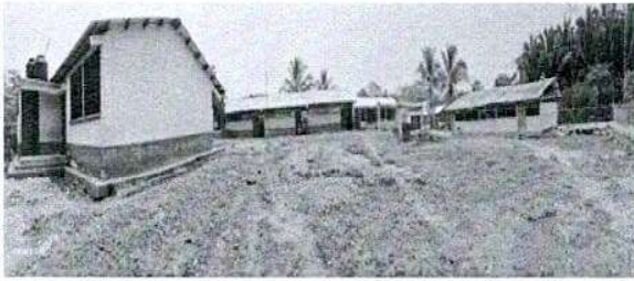
Foto1: Vista general del establecimiento.