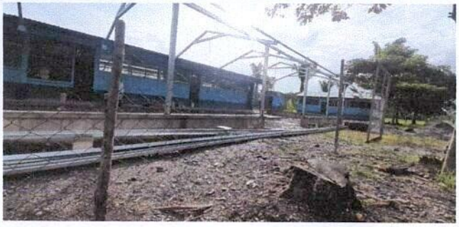
Foto1: vista general del establecimiento.