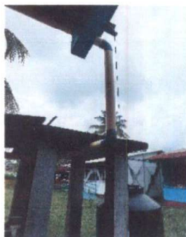
Foto 5 modulo 1: suministro tinaco 2500 L y canal, bajada de agua pluvial