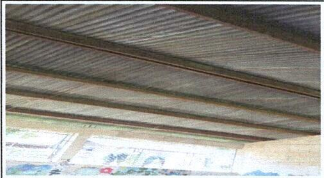
Mantenimiento a estructura de soporte de metal