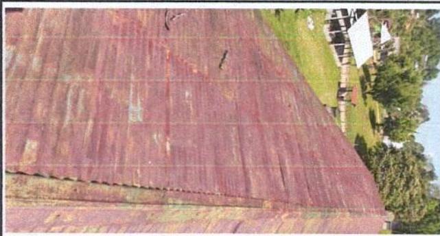
Sustitución de capote de lámina para lámina troquelada