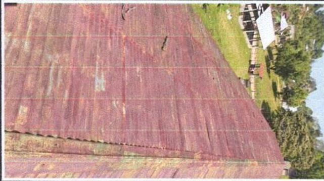
Sustitución de las láminas del techo del edificio escolar