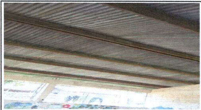
Sustitución de elementos de fijación