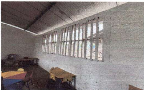
Foto 5: LAS AULAS NO CUENTAN CON VENTANERIA DE VIDRIO, SIENDO ESTAS ACTUALMENTE DE MADERA IMPROVISADAS.