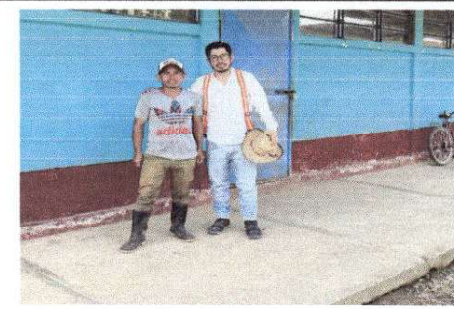
Foto 12: FOTO CON PRESIDENTE OPF DE LA ESCUELA, AL FINALIZAR VISITA.