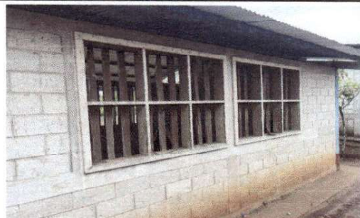
Foto 4: EXTERIOR POSTERIOR DEL MODULO TAMPOCO CUENTA CON PINTURA.