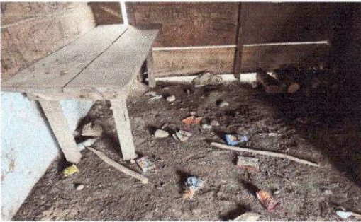
Foto 9: MODULO DE COCINA, NO CUENTA CON PISO, SIENDO ESTE DE TIERRA EN LA ACTUALIDAD.