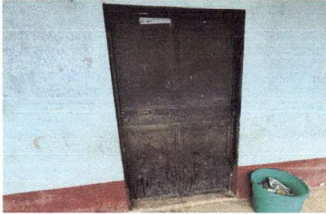
Foto 7: PUERTAS DE METAL DE LAS AULAS, EN MALAS CONDICIONES Y DAÑADAS.