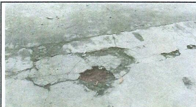
Foto 4: Sustitución de piso de torta de cemento por piso de cerámico.