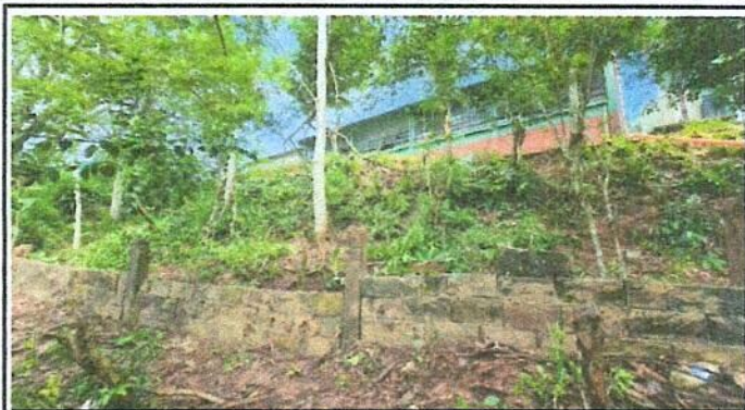
Foto 2: Muro de contención, levantado de muro con blok de arena, soleras intermedias y columnas,