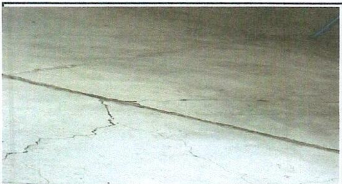
Foto 3: Sustitución de piso de torta de cemento por piso de cerámico.