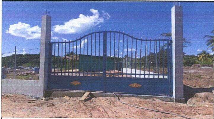
Foto1: Reparación de muro perimetral de block con tubo hg y malla galvanizada, soleras intermedias y columnas