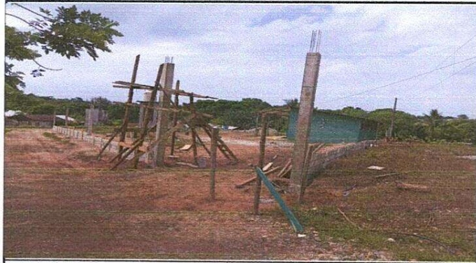
Foto1: Reparacion de muro perimetral de block con tubo hg y malla galvanizada, soleras intermedias y columnas