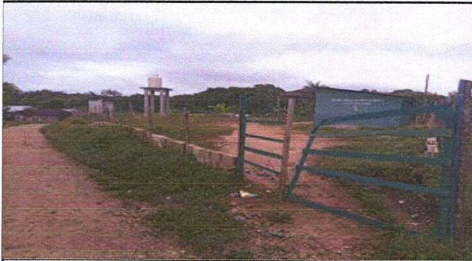
Foto 1: Reparación de muro perimetral de block con tubo hg y malla galvanizada, soleras intermedias y columnas