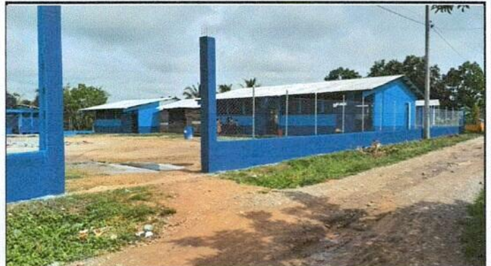
Foto 2: Vista frontal con pintura en muros exteriores e interiores