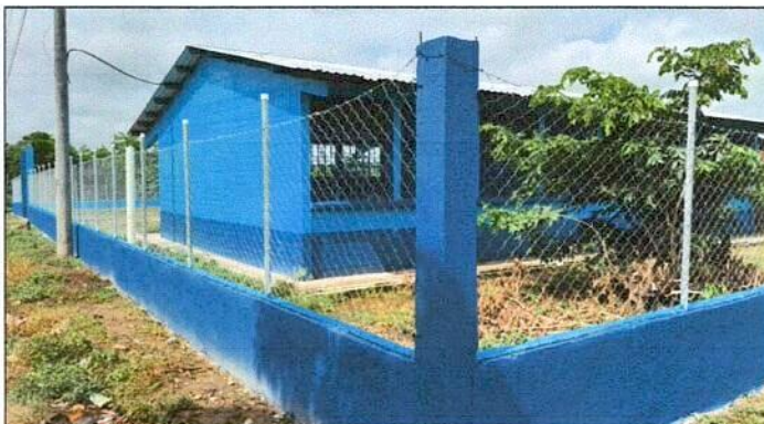
Foto 3: Vista parte de atrás con pintura en muros exteriores e interiores