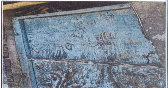
Foto: sustitucion de puerta