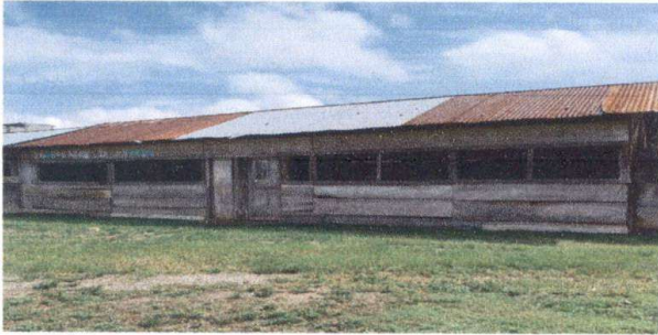
Foto 1: Sustitucion de lámina por lámina troquelada aluzinc calibre 26