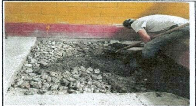
Foto 2: padre de familia trabajando el espacio para la torta de cemento.