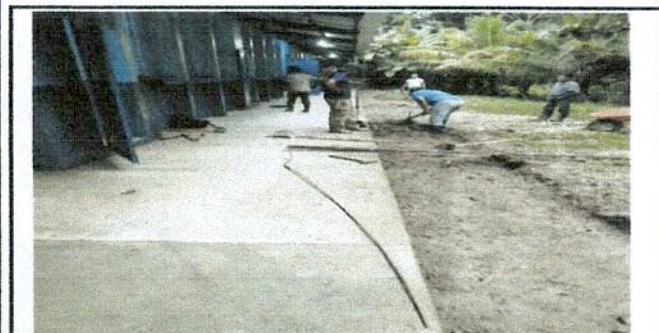
Foto 5: padres de familia arreglando espacio para la ampliacion del corredor con un pedazo de torta de cemento.