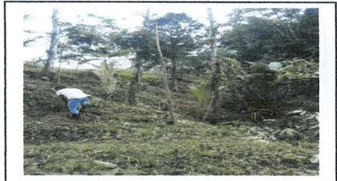
Foto 4: Padre de familia trabajando los poste para la cerca de la malla