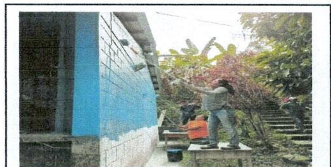
Foto 6: padres apoyando con la pintada la parte de atrás de la escuela.

Observación: Si es necesario se pueden agregar hojas adicionales y actualizar el número de hojas.